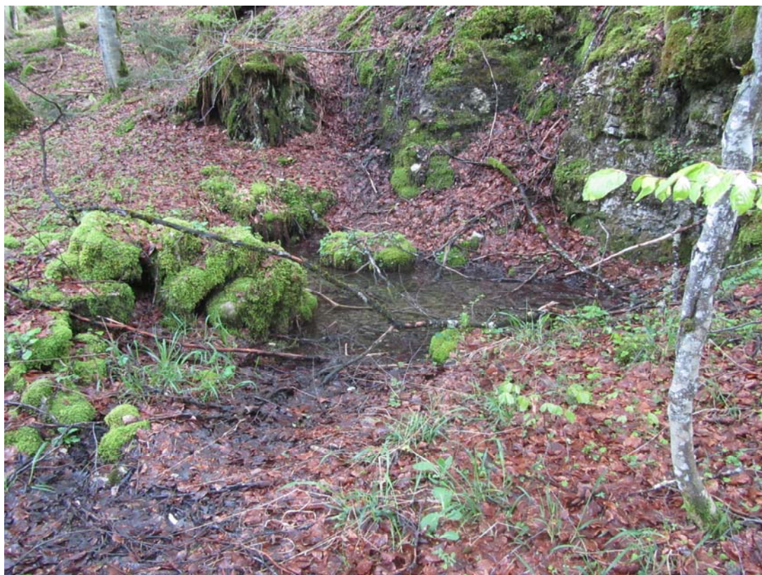
Une goutte d'eau, ni plus, ni moins !